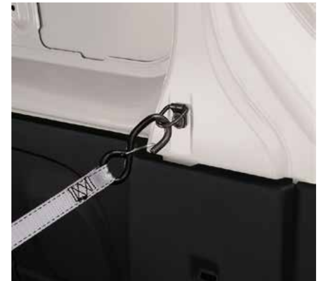
Anillas de anclaje