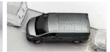
Cámara de reversa