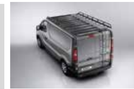
Parrilla de techo