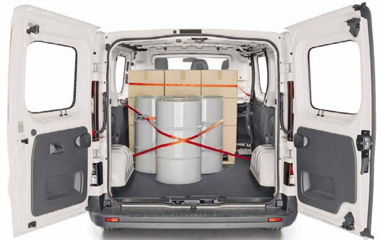
Zona de carga

Fotos de referencia. Accesorios se venden por separado.